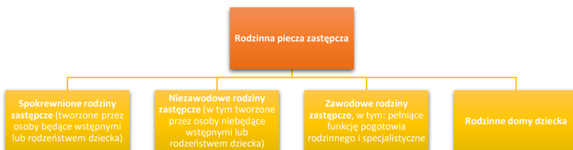
Rysunek 1. Model rodzinnej pieczy zastępczej oparty na ustawie z dnia 9 czerwca 2011 r. o wspieraniu rodziny i systemie pieczy zastępczej.